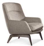
03 BELT BERGÈRE CM 78X84 H93